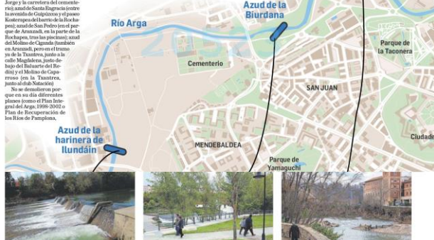
AZUD HARINERA DE LLUNDAIN Pasado. Se utilizó la energía como fuente de energía para accionar la maquinaria del molino. Hay referencias al molino de Llundain desde el siglo XII. La presa es una estructura muy anterior a las murallas del XVI. Presente. Ahora se hacen captadores de agua para riegos de huertas en su margen que quedan a derecha. También registra la visita de pescadores.

Me frente a las inundaciones provocadas por el Ebro. "Eliminar las esclusas que actúan como presas favoreciendo la sedimentación sería poder reducir aún más este riesgo". Una situación similar, dice, ocurre en aguas abajo del puente de la avenida Anselmi, en cuya margen derecha la Sociedad Deportiva Echarrroch tiene un muro de cierre cuando, a modo de gran tapa y regradada que cumple la misma función que la misma, se produce el corte de las inundaciones.