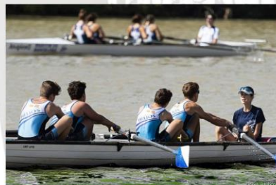
PUERTO FLUVIAL DE VADORREY – RIO EBRO – ZARAGOZA 22 de OCTUBRE de 2023 – De 09:00 a 14:00 h. Categorías : Cadetes, Juveniles, Senior y Veteranos