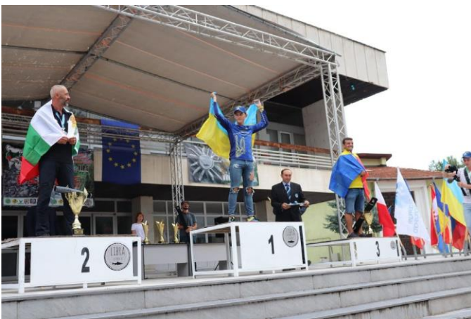
18th WORLD CHAMPIONSHIP CARNIVOROUS ARTIFICIAL BAIT SHORE ANGLING FOR NATIONS, DEVIN – 2021

07:00 - Reunión de capitanes, sorteo y entrega de números 09:00 – 1 a señal – inspección del sector 09:30 – 2 a señal – entrada en los sectores 09:45 – 3 a señal – comienzo del 1er periodo 10:30 – 4 a señal – final del 1er periodo 10:45 – 5 a señal - comienzo del 2 o periodo 11:30 – 6 a señal - final del 2 o periodo 11:45 – 7 a señal - comienzo del 3er periodo 12:30 – 8 a señal - final del 3er periodo 12:45 – 9 a señal - comienzo del 4 o periodo 13:30 – 10 a señal - final del 4 o periodo 15:30 – Ranking Final 18:00 - Entrega de premios en la Plaza del Municipio – Devin. 20:00 – Cena de Gala en ORPHEUS SPA & RESORT