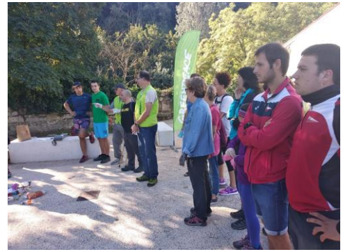
Personal del club colaborando en la última jornada de limpieza del río.

En el transcurso del Arga por Pamplona, actualmente son varias las presas existentes que crean unas zonas con aguas embalsadas, y otras sin presas que embalsen el agua, los supuestos beneficios que se aportaría al río, en caso de no repararse, serían limitados al tramo que discurre entre la anterior presa de San Pedro hasta la siguiente presa de San Jorge en cuanto a sedimentos, etc. y en el caso de la Fauna, hemos podido apreciar un notable descenso en la cantidad de ésta, incluso hasta la desaparición de ciertas especies (garzas por ejemplo, quedando solo unos pocos patos), y que es la propia Federación Navarra de Pesca la que solicita la reparación de la presa, siendo éstos los más interesados en la riqueza de la Fauna de la zona, nosotros como vecinos, y como usuarios del río, respetamos a éste, y no nos tomamos a la ligera, las consecuencias de que en verano vaya prácticamente seco, desapareciendo prácticamente la fauna, y se desborde en invierno y primavera. Las personas del club somos los primeros interesados en la mejor conservación del cauce: retirando vegetación muerta del puente del Plazaola, y basura que trae el río.